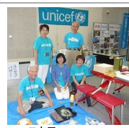
ユニセフ チャリティーパーザー

◇同時開催 11:40~15:30 (ホワイエにて) 『原爆パネル展』『ユニセフ・チャリティーパーザー』『ナガサキへ折鶴を届けようコーナ』『生協の平和活動展示』