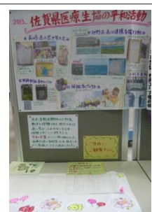
各生協の 平和活動 紹介展示